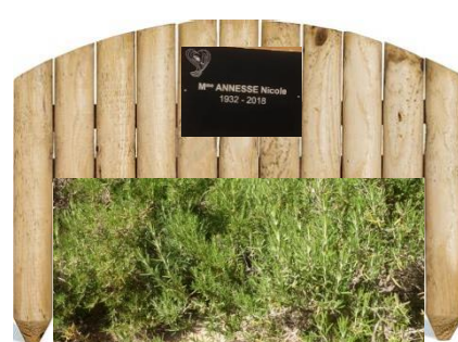
Idée d'embellissement avec romarin