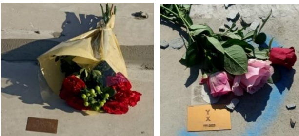
Bouquets de fleurs que nous déposons lors des inhumations

En 2023, nous avons commencé à rédiger un « compte-rendu » des funérailles qui se veut être une trace écrite à disposition des familles que nous pourrions retrouver ou qui se manifesterait. Nous indiquons le texte que nous avons lu, prenons en photo le bouquet, la plaque sur la tombe.