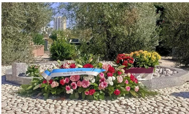
Jardin du souvenir

La cérémonie se termine en allant déposer les fleurs sur chacune des tombes.