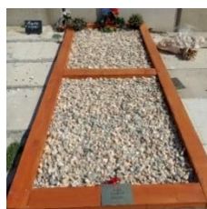
Idée d'embellissement sans gravier et avec un pochoir ?

Nous avons utilisé les derniers matériaux stockés chez l'ancien président de l'association : une dizaine de revêtements de tombes en pelouse synthétique pour les tombes en revêtement durs, et 2 cadres en bois pour les tombes en pleine terre.