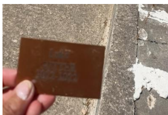
Plaque descellée retrouvée à quelques mètres